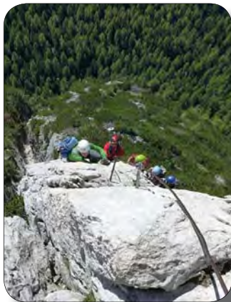
Copertina: Ferrata al Col Rosà - Cortina - Corso di Alpinismo modulo “Ferrate e vie normali”

La Segreteria è aperta: - il martedì dalle 21.00 alle 23.00 - il mercoledì dalle 18.00 alle 19.00 - il venerdì dalle 11.00 alle 12.30