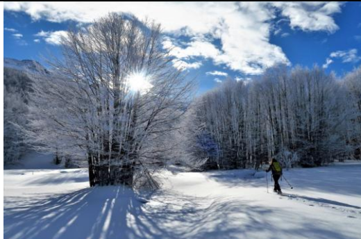
Tra i boschi di faggi

Durata escursione : ore 06:30 soste comprese