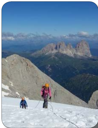
Copertina: Corso di Alpinismo 2015 Verso Punta Penia - Marmolada

La Segreteria è aperta: - il martedì dalle 21.00 alle 23.00 - il mercoledì dalle 18.00 alle 19.00 - il venerdì dalle 11.00 alle 12.30