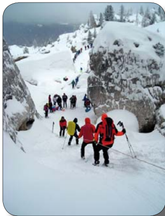
Copertina: Ciaspolata alle Cinque Torri

La Segreteria è aperta: - il martedì dalle 21.00 alle 23.00 - il mercoledì dalle 18.00 alle 19.00 - il venerdì dalle 11.00 alle 12.30