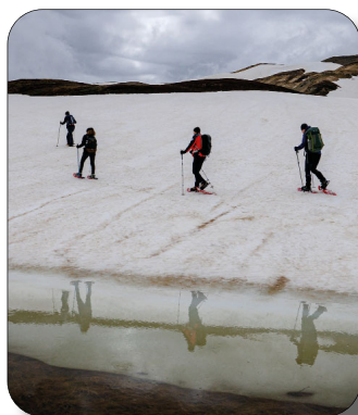
Copertina: Ultimi riflessi d'inverno - Corno alle Scale (BO) Foto I classificata Concorso Fotografico 2021 Categoria: Attività ufficiali della Sezione

La Segreteria è aperta: - il martedì dalle 21:00 alle 23:00 - il mercoledì dalle 18:00 alle 19:00 - il venerdì dalle 11:00 alle 12:30 Verificare gli orari di apertura sul sito.